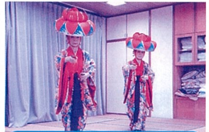
玉城流敏風末美乃会 琉舞サークルレインボー