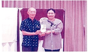
北谷ライオンズクラブ様より寄附