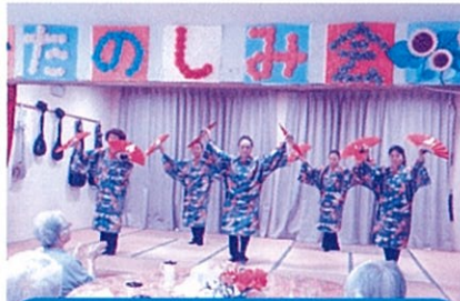
北谷町民踊愛好会