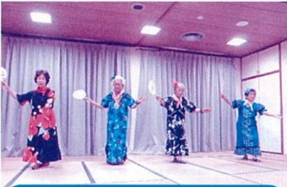
ハピネスフレンド