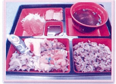
お昼の御馳走 幕の内

ボランティアの皆さん!ありがとうございました。 地域の方々と関わり合い、触れ合えるお楽しみ会です! これからも、参加、ご協力のほど宜しくお願いします。。。